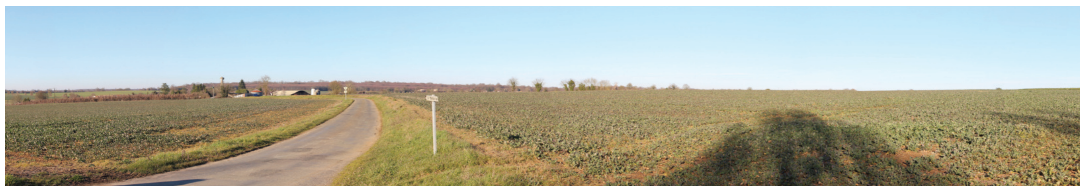
Vue panoramique de l'état initial (angle de vue 120°)