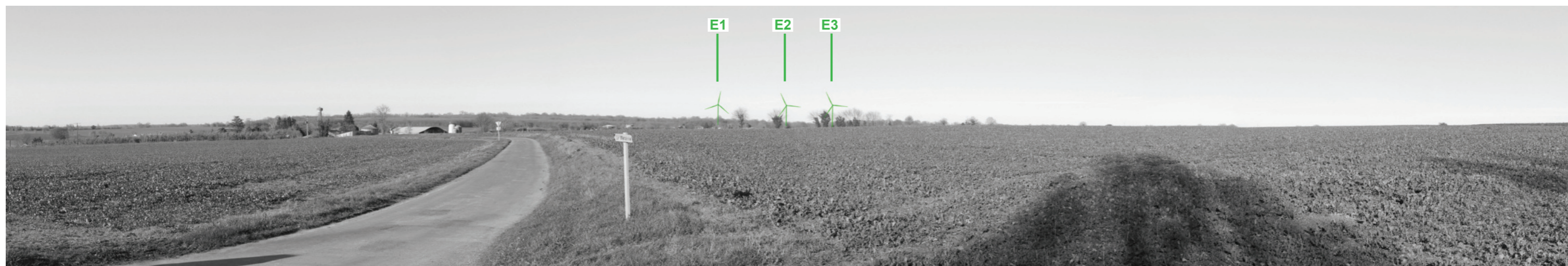
Vue panoramique noir et blanc avec esquisse du projet (angle de vue 120°)

Coordonnées Lambert II étendu : 412781,6 / 2136691,2 Date et heure de la prise de vue : 15/02/2019 à 18:05 Focale : 52 mm, équivalent 24 x 36 Azimut vue réaliste : 24° Angle visuel du parc : 8,7° Eolienne la plus proche : E3, à 3 642 m